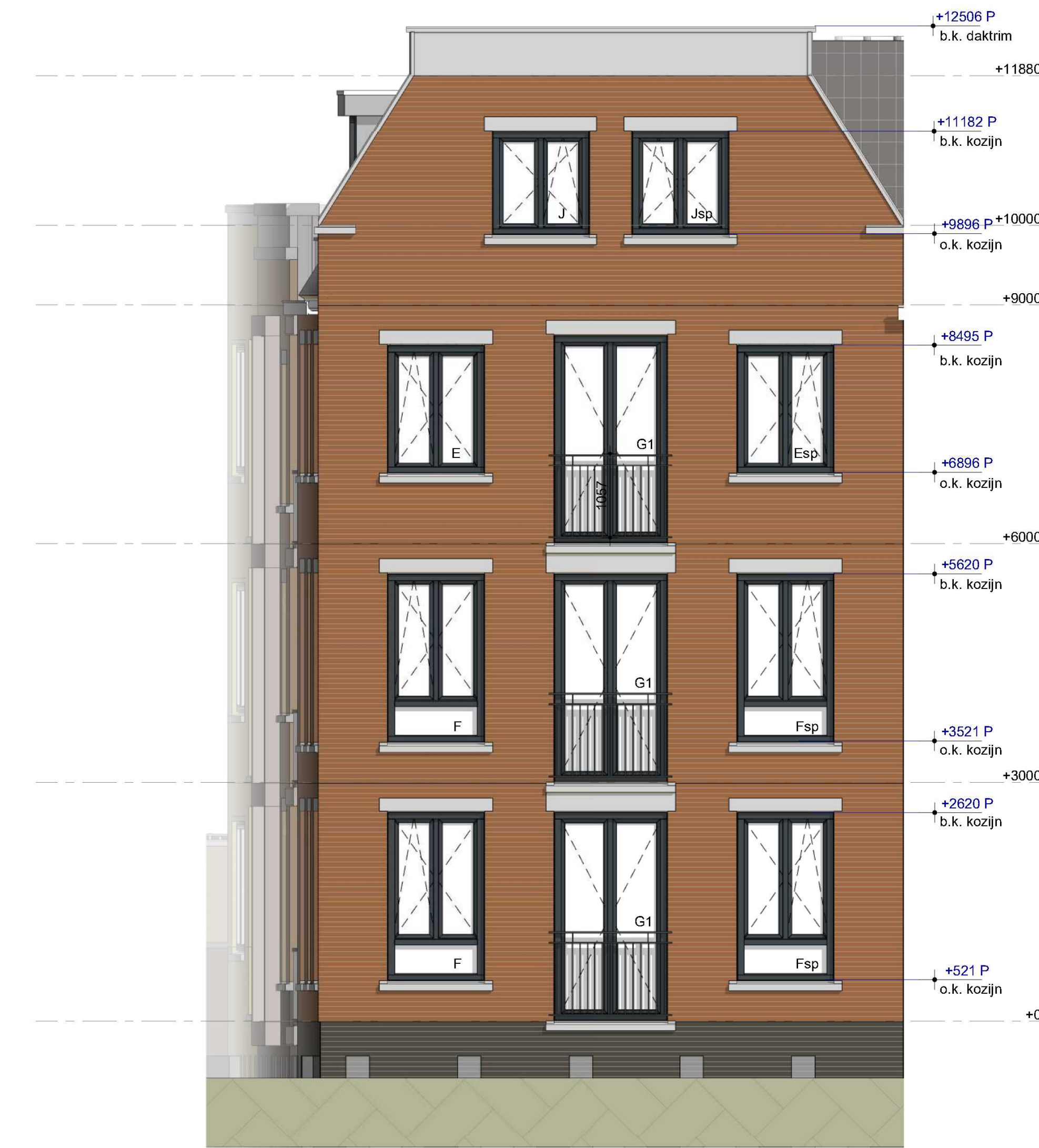
westgevel sectie 1