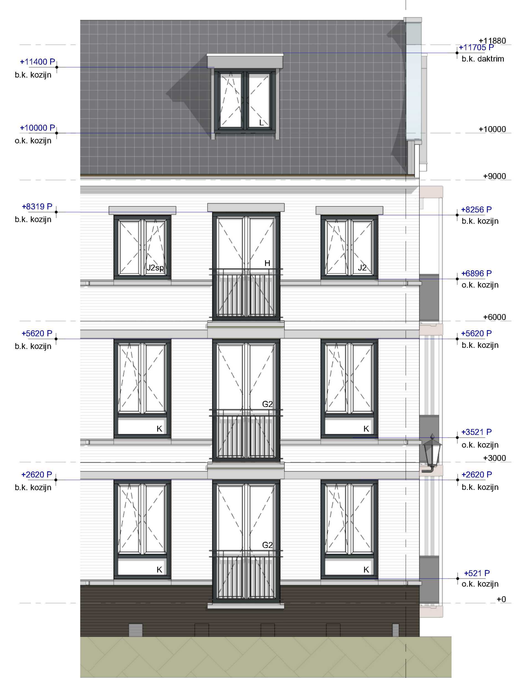
westgevel sectie 5