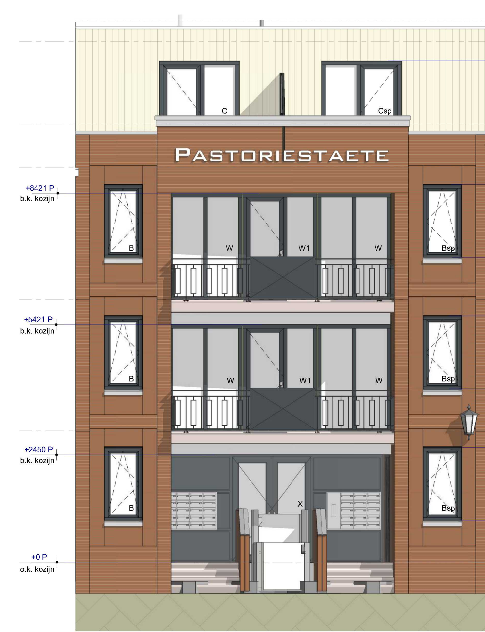
westgevel sectie 3