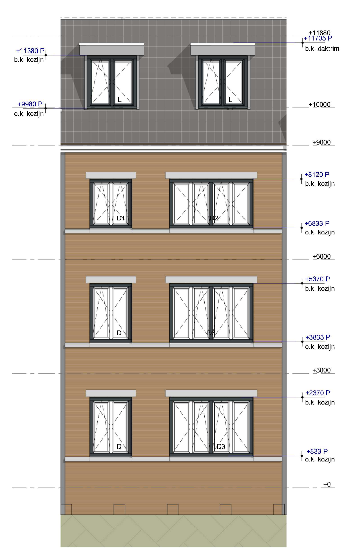
westgevel sectie 2