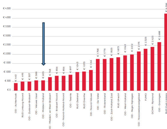
Figuur 5. Realisatie BTP 2022 per inrichting (exclusief type A-inrichtingen, N=23)

Dit hebben we meerjarig kunnen realiseren zonder in te boeten op onze kwaliteit en dienstverlening en zonder een negatief jaarrekeningresultaat te hoeven presenteren aan onze deelnemers. Dat de ODMH doelmatig werkt blijkt ook uit de tweejaarlijkse rapportage ‘Omgevingsdiensten in Beeld 2023’. Dit onderzoek laat het Rijk uitvoeren als onderdeel van de kwaliteitsborging binnen het VTH-stelsel. De volgende figuren uit deze rapportage tonen dat de ODMH kostenefficiënt opereert in vergelijking met andere omgevingsdiensten. De linkerfiguur geeft de kosten van de OD per inrichting, de rechterfiguur het aantal FTE dat nodig is voor de VTH-uitvoering. De blauwe pijl is de positie van de ODMH.