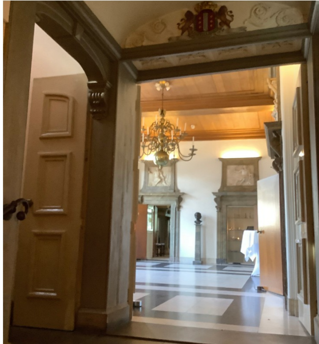
de huidige deuren (1952) blokkeren de nieuwe vluchtroute via trappenhuis 0.05