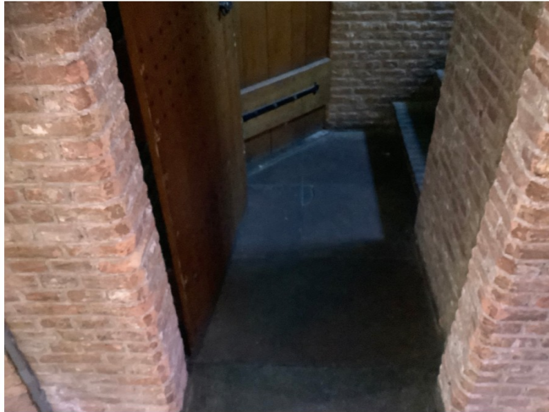
huidige situatie hal naar trap