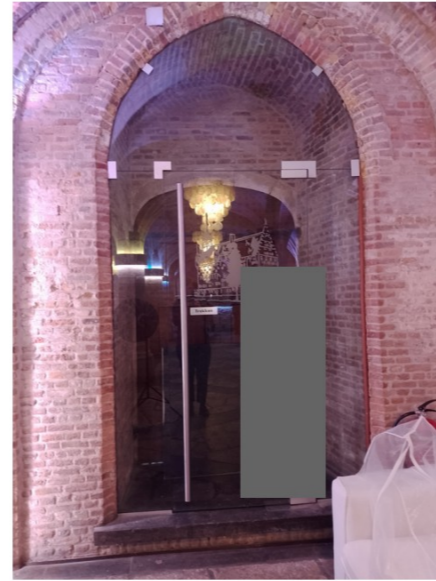
huidige situatie entree