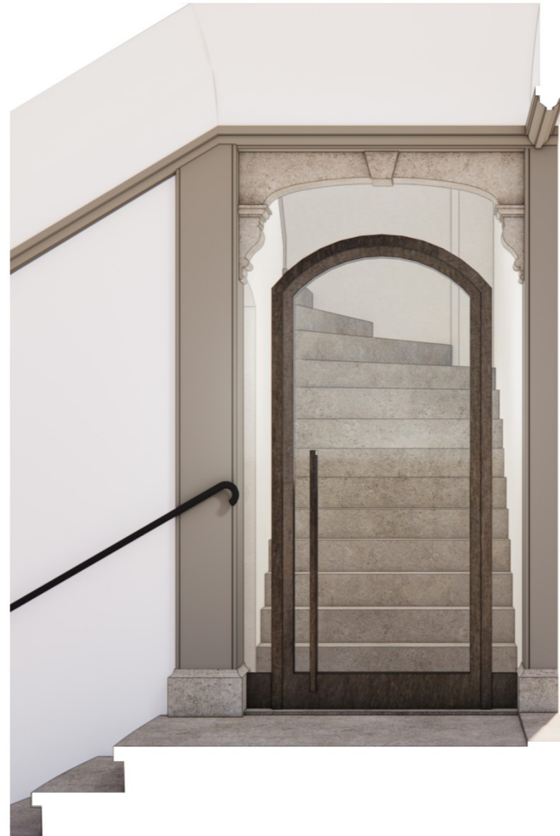
nieuwe doordraaiende deur i.v.m. brandveiligheid, met platte boog, passend in natuursteen ornamentiek en bij overige nieuwe deuren