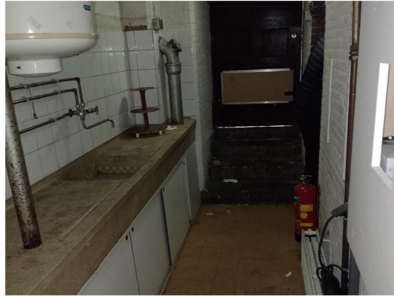
huidige situatie keuken in tussenruimte