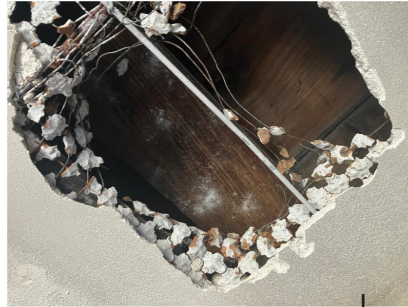
houten plafond met kinderbinten is nog aanwezig