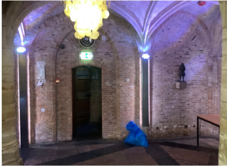
huidige situatie doorgang naar trap