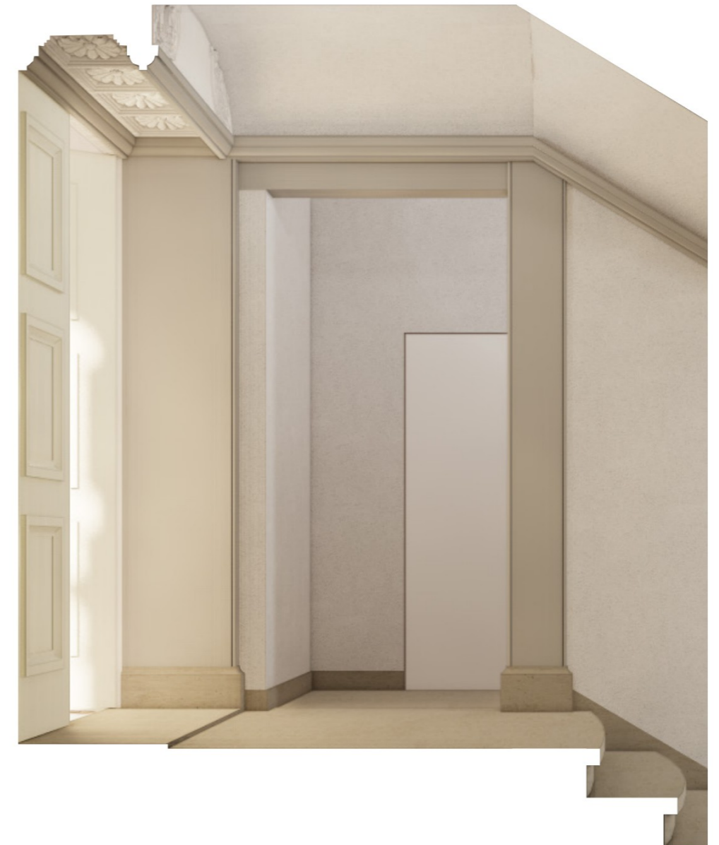
de houten deur en vlakvulling wordt verwijderd om een verbeterde toegankelijkheid van en naar de lift te realiseren