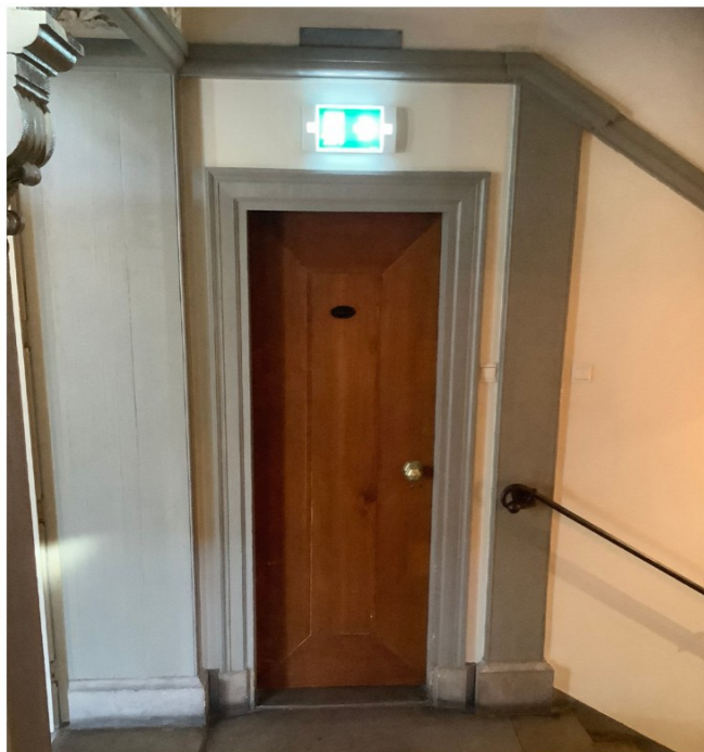
de deur en draaicirkel zijn te krap voor een goede integrale toegankelijkheid