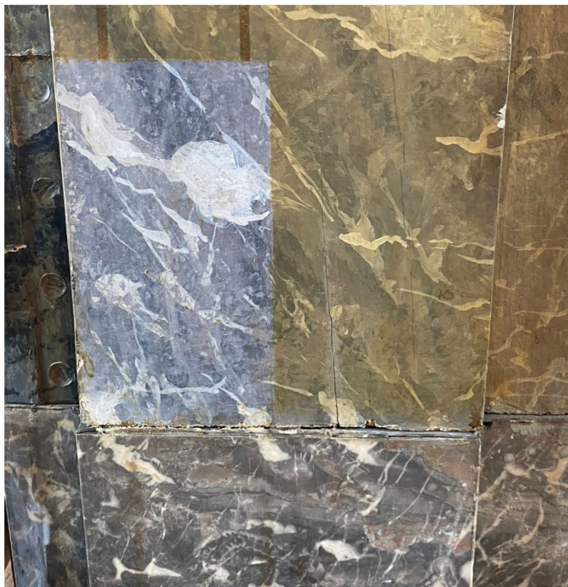
een proef laat zien dat de sterk verkleurde vernis op de deuromlijstingen goed te verwijderen is