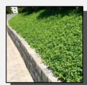
Vinca Minor ("Maagdenpalm")