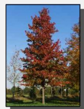
Liquidambar styraciflua (Amberboom)

— BGT Terrein — BGT Bebouwing (Onderlegger: Basisregistratie Grootschalige Topografie)