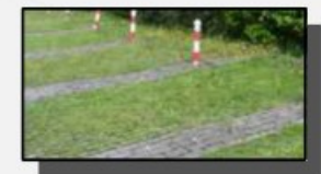
Gras keien (opgesloten tussen BKK klinkers)